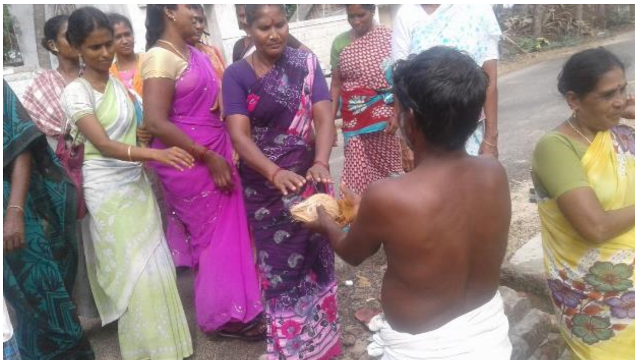
Coconut touched by the Public gathering