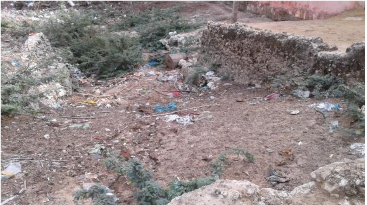
Status of Panacha Teertham before starting renovation

Panacha Teertham is located in the Mangadu Village Ward no.16 of Rameswaram Municipality.