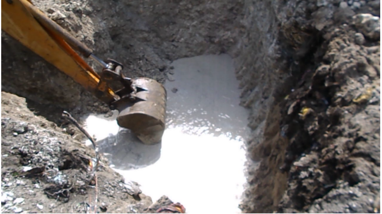
Excavation work is on .....