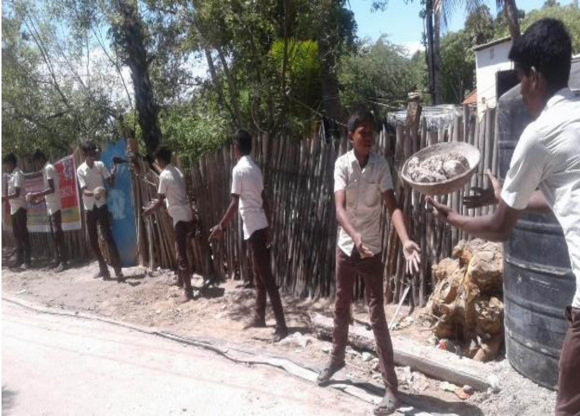
Panacha Teertham Renovation supported by NSS Volunteers of Government Boys Higher Secondary School