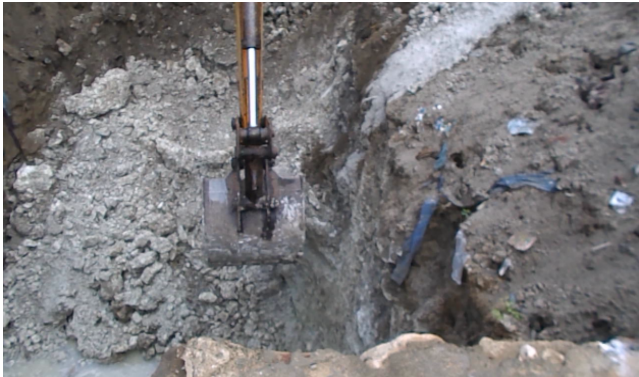
Desilting the waterbody