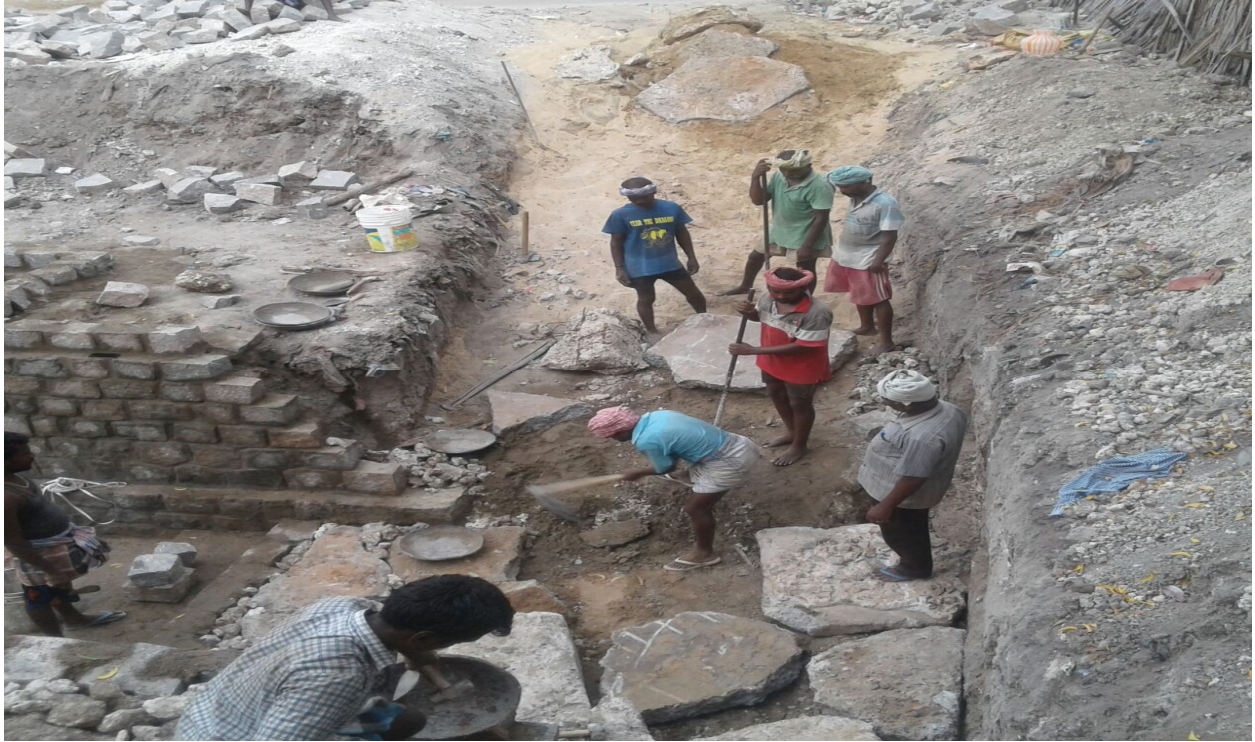
Laying foundation stones