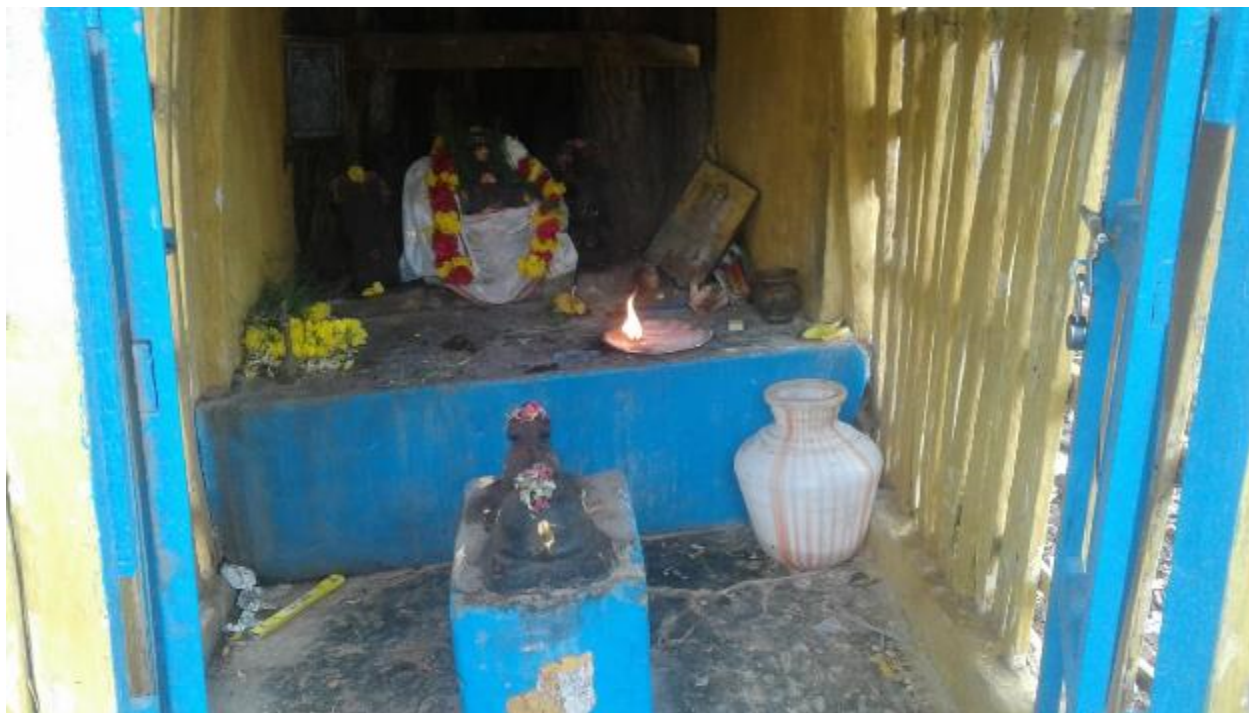
Renovation of Teertham started with the Pillaiyar Pooja near Panacha Teertham