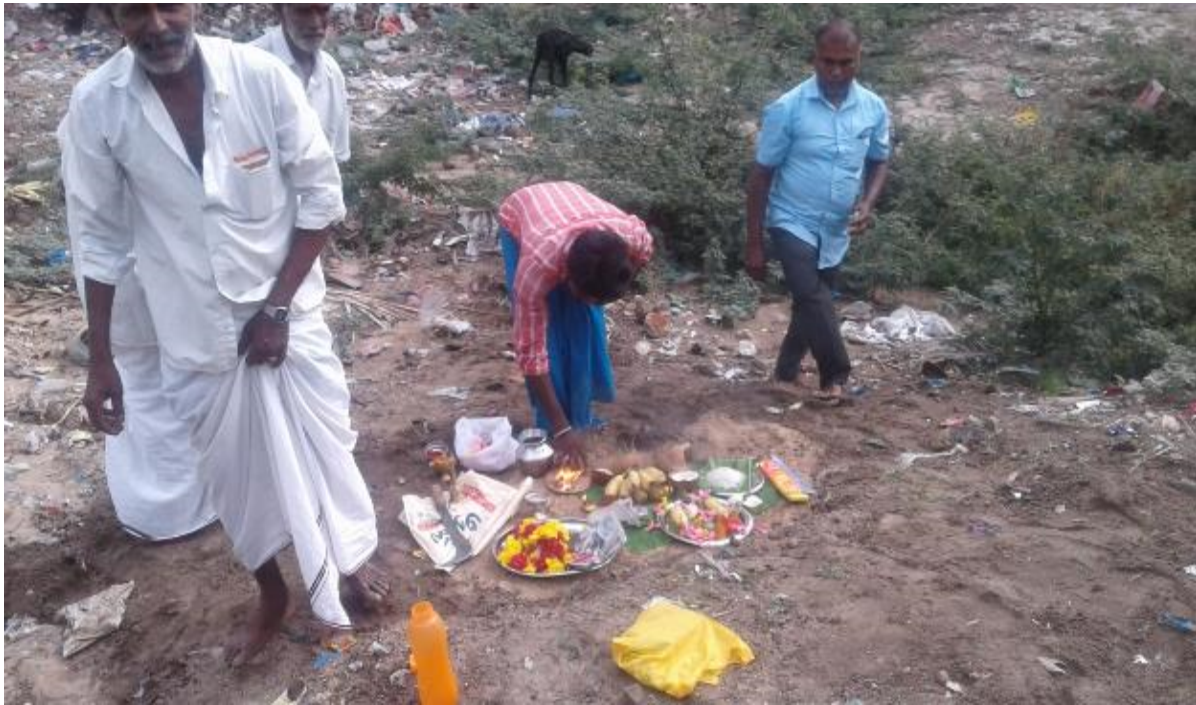
Traditional Bhumi Pooja before starting the work at Panacha Teertham