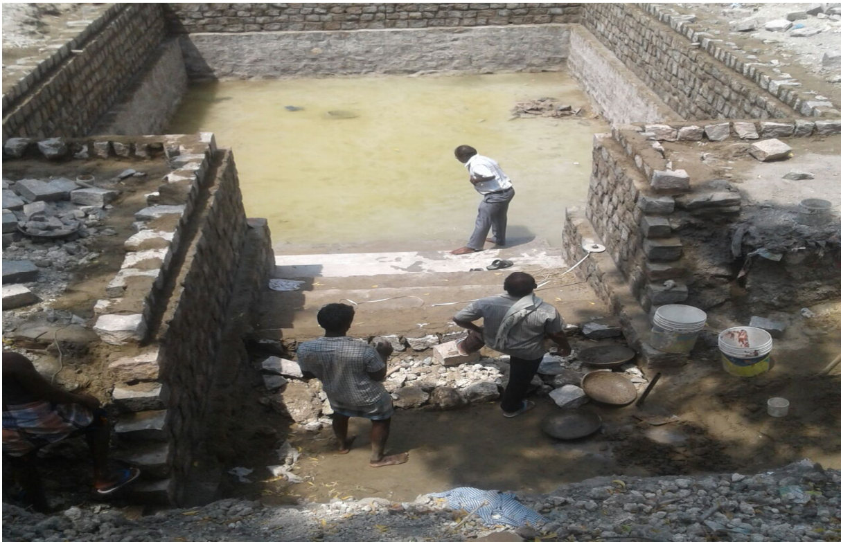
Work is in progress ....