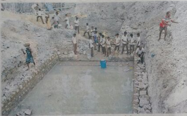
▶ மாங்காடு கருப்பட்டி குளத்தை தூர்வாரும் பணியில் ஈடுபட்ட ராமேஸ்வரம் அரசு மேல்நிலைப்பள்ளி மாணவர்கள்.

ஆண்டுகள் பல கடந்ததால் மணலில் புதைந்து இருந்த இடம்தெரியாமல் போனது. ராமேஸ்வரம் தீவின் நன்னர் ஆதாரங்களாக விளங்கிய இந்த தீர்த்தக் குளங்கள் இருந்த இடத்தைக் கண்டு பிடித்து சீரமைத்து மீண்டும் பயன்பாட்டிற்குக்